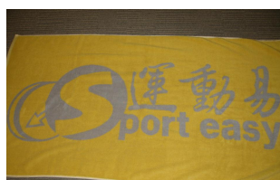
運動毛巾 (共 1800 份)