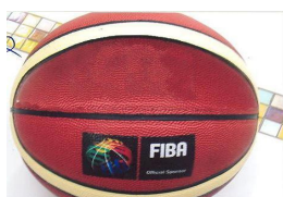
籃球 (共 300 份)