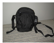
運動型側身袋 (共 300 份)