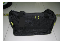
運動袋 (共 300 份)

② 運動試驗計劃-30 小時的挑戰：為鼓勵更多較少運動的會員增加運動次數，培養每天運動的良好習慣，建議會員可嘗試持續進行體育運動，當累積時數達 30 分，便可扣積分換領紀念品保溫杯或大毛巾乙份。