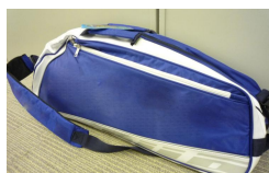
羽毛球袋 (共 300 份)