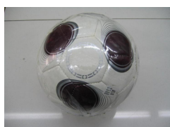
足球 (共 300 份)